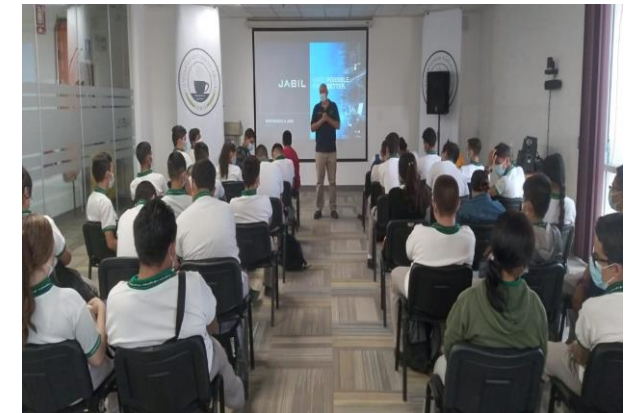
Visita a Jabil del Alumnado de Plantel Chihuahua I